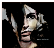
Maika Makovski "Maika Makovski" ORIGAMI

llevó a su sello. Entrar en su disco y empezar a enamorarse es todo uno: una de esas bellas voces nasales, facilidad para el pastiche estético y afición al cacharreo electrónico. Se abre, lógicamente, con lo que es su canción más escuchada y resultona. Agría y encantadora como un buen bocado de wasabi, "Feed me to the wolves" se esconde en un triste bucle de melodía altamente adictivo, y aclimata mente y cuerpo para el resto del disco: canciones que se han olvidado del 'estrofa+ estribillo' y se acomodan en formatos más parecidos a espirales o a bloques de pisos. House trotón junto a fragilidad indie; guitarras de aire folk entre ruiditos y samples de conversaciones telefónicas que hacen recordar aquellos impresionantes discos de Scanner. Apariencia festiva para textos de desamparo emocional. Después de cuarenta escuchas puedo declarar que en esto consiste la contemporaneidad: ¡Todo se puede bailar! Carolina León